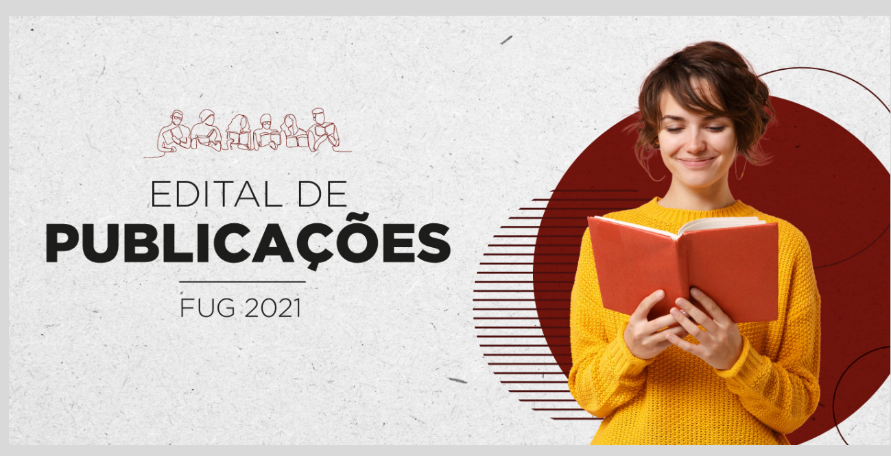
Acesse o portal da FUG e envie sua obra para avaliação do Conselho Editorial.

A Fundação Ulysses Guimarães lançou o Edital Nº 01/2021, que dispõe sobre as regras para submissão de artigos, ensaios e livros a serem publicados pela FUG. O objetivo é fomentar o conhecimento científico, pilar civilizatório e conquista da sociedade, promovendo debate teórico sobre as principais estratégias democráticas contemporâneas.