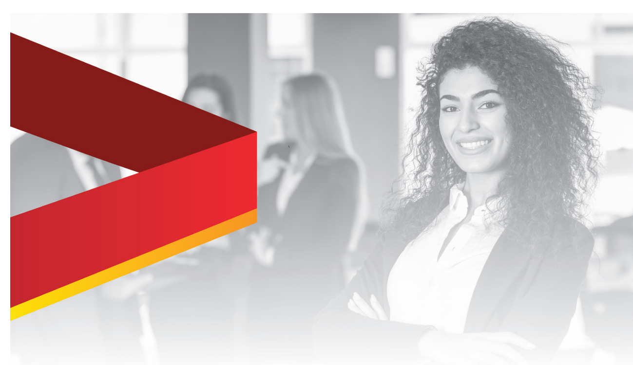
Fundação Ulysses Guimarães lança Escola de Líderes nos próximos dias.

Nos próximos dias, a FUG lança o Movimento - a Escola de Líderes da Fundação Ulysses Guimarães, que tem o objetivo de transformar quadros partidário em líderes humanizados e conscientes do seu papel na sociedade, além de prepará-los para assumir cargos de liderança em todos os níveis, oferecendo formação em áreas estratégicas do conhecimento político, econômico e social.