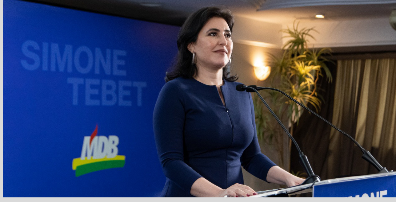
Lançamento da pré-candidatura de Simone Tebet à Presidência da República.

A Executiva Nacional do MDB oficializou a pré-candidatura da senadora Simone Tebet à Presidência da República. A reunião que decidiu pelo nome da senadora aconteceu em Brasília, no último dia 08, e contou com a participação de senadores, deputados federais e estaduais, presidentes dos diretórios estaduais, governadores, prefeitos, vereadores, diretoria da FUG e militantes.