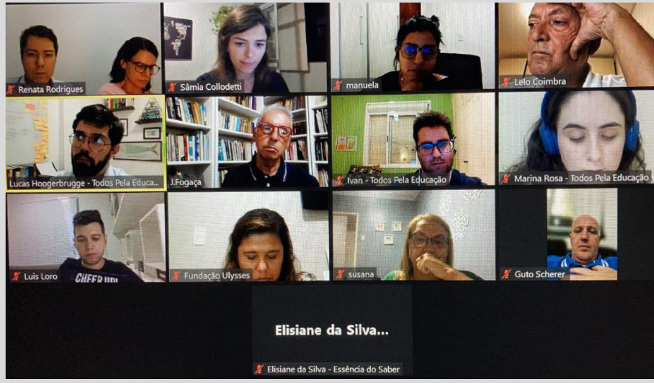
Reunião realizada com a equipe da Fundação Ulysses Guimarães e representantes do Todos pela Educação

Dando continuidade ao Projeto “Educação no Centro”, a Fundação Ulysses Guimarães recebeu para uma roda de debates especialistas do Todos Pela Educação. O projeto que está sendo desenvolvido pela FUG tem com foco a Educação Infantil e o Ensino Fundamental e respectivos temas transversais, o Ensino Médio e Superior, e visa levantar informações e ideias para a formulação de um documento propositivo, síntese de plataforma de governo e temático para estados e municípios.