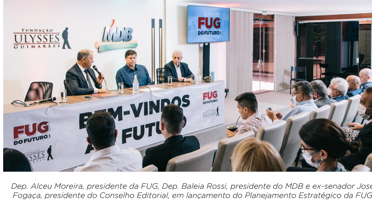
Dep. Alceu Moreira, presidente da FUG, Dep. Baleia Rossi, presidente do MDB e ex-senador José Fogaça, presidente do Conselho Editorial, em lançamento do Planejamento Estratégico da FUG.

A construção democrática, que incentiva um ambiente plural, inclusivo e participativo, foi o grande balizador para elaboração do Planejamento Estratégico da Fundação Ulysses Guimarães. Produzido pela PandoraBox Consultoria, em parceria com a Diretoria Administrativa e o Conselho Editorial da FUG, o documento será o guia orientador para as ações da Fundação pelos próximos 15 anos.