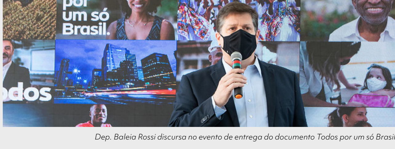
Dep. Baleia Rossi discursa no evento de entrega do documento Todos por um só Brasil.

O documento " Todos por um só Brasil " foi entregue ao presidente nacional do MDB, Baleia Rossi, para ser discutido com as instâncias partidária e receber contribuições. "Hoje, como presidente nacional do MDB, recebo esse documento da Fundação Ulysses Guimarães. Um documento com muito conteúdo, formulado por muitas cabeças pensantes, pessoas que se preocupam com o futuro do nosso país e principalmente, com a qualidade de vida daqueles que vivem aqui. Aliás, não poderia ser diferente. Um documento