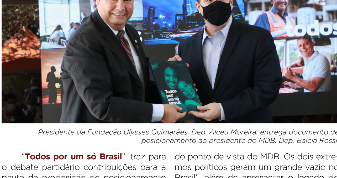
Presidente da Fundação Ulysses Guimarães, Dep. Alceu Moreira, entrega documento de posicionamento ao presidente do MDB, Dep. Baleia Rossi.

POSICIONAMENTO POLÍTICO DE CENTRO E SOLUÇÕES PARA O PAÍS