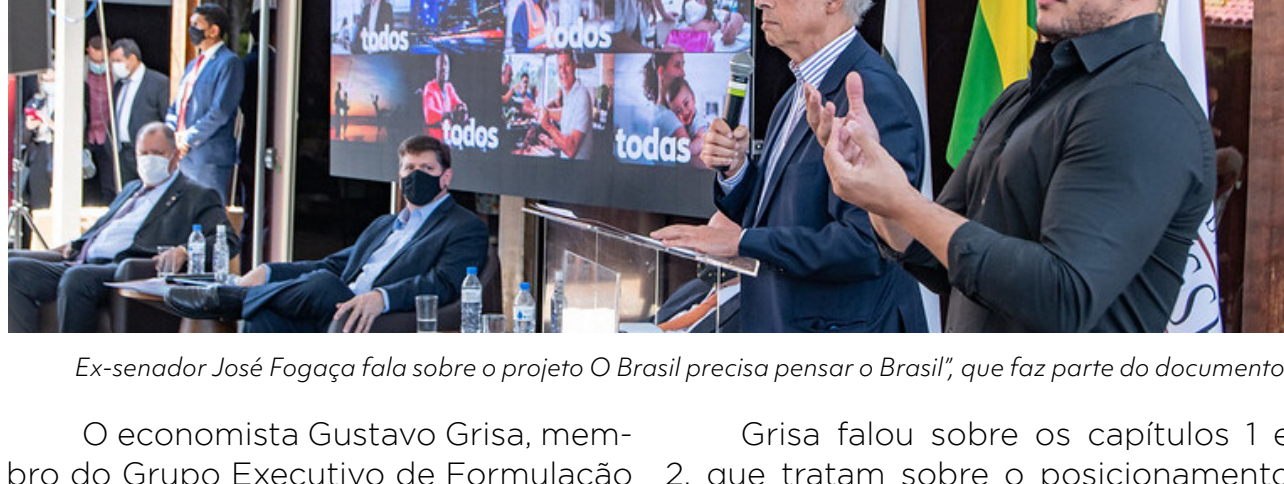
Ex-senador José Fogaça fala sobre o projeto O Brasil precisa pensar o Brasil, que faz parte do documento.

O economista Gustavo Grisa, membro do Grupo Executivo de Formulação de Conteúdo e Comunicação, e o ex-senador José Fogaça, presidente do Conselho Editorial de Publicações da FUG (CONEP), também falaram no evento de lançamento do "Todos por um só Brasil". Ambos são da equipe que coordenou e redigiu o documento.